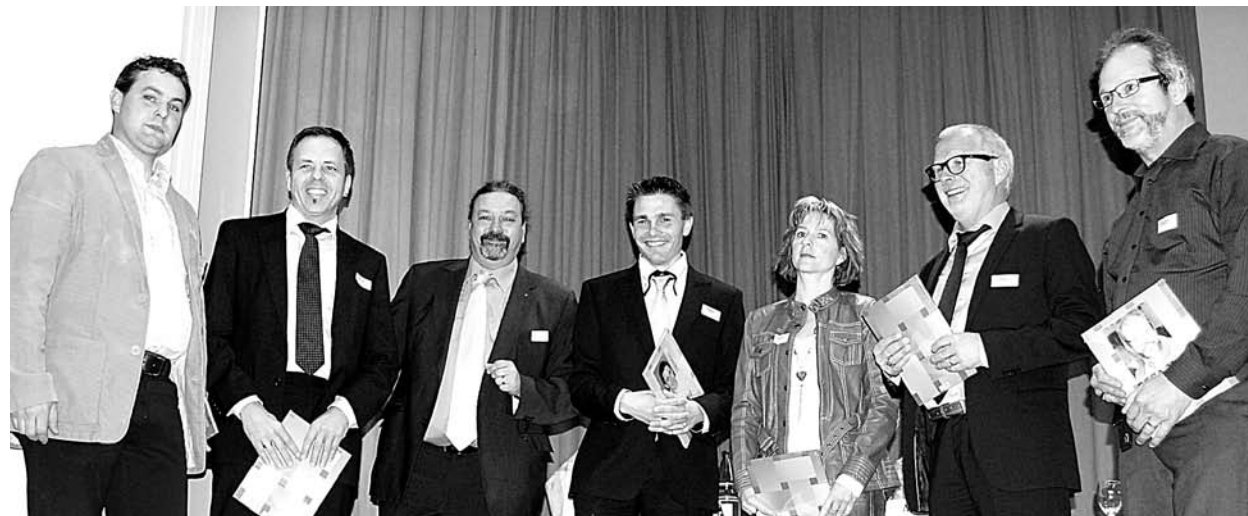
Das OK-Team der Rega freut sich an den personalisierten Bildbänden.